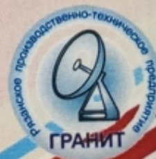
АО «РЯЗАНСКОЕ ПРОИЗВОДСТВЕННО- ТЕХНИЧЕСКОЕ ПРЕДПРИЯТИЕ «ГРАНИТ»