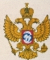
УПОЛНОМОЧЕННЫЙ ПО ПРАВАМ РЕБЕНКА В РЯЗАНСКОЙ ОБЛАСТИ