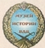
МУЗЕЙ ИСТОРИИ ВДВ