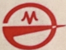
ПАО ЗАВОД «КРАСНОЕ ЗНАМЯ»