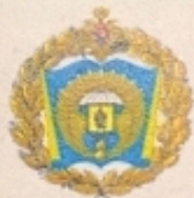
РГВВДКУ ИМ. ГЕНЕРАЛА АРМИИ В.Ф. МАРГЕЛОВА